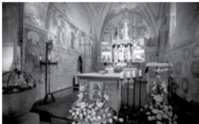
Súčasný pohľad do svätyne kostola sv. Martina v Čeríne