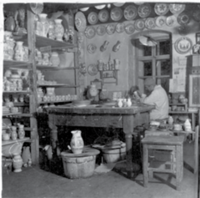
Časť dielne – maliareň v Ľubietovej v roku 1952.

Medzi najzaujímavejšie predmety patria dva veľké ozdobné taniere. Prvý z nich má priemer 46,5 cm s rastlinnou a figurálnou výzdobou. Figurálny motív zobrazuje obsah žartovnej ľudovej piesne, po obvode taniera sa nachádza text piesne: Ej, komuže je lepšie, ako je neveste, muža nabá doma, ona pije v meste. Ej, a keď prišla domov, začala si skákať, a muž neboráčik, pustil sa jej plakať. Ej, vzala dve paličky, podoprela