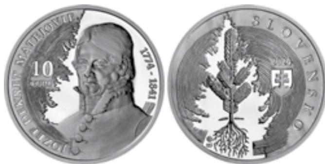
Zberateľská strieborná minca v nominálnej hodnote 10 euro s portrétom Jozefa Dekreta Matejovie z roku 2024.

V roku Jozefa Dekreta Matejovie sa uskutočnilo veľké množstvo rôznych spomienkových podujatí. Dňa 21. marca 2024 vyhlásili všetky banskobystričné Dekretove pamätníky (busta a parčík v Národnej ulici, pamätný kameň na mieste, kde stál jeho dom v Hornej ulici a jeho hrob na miestnom rímskokatolíckom cintoríne) za „významnými lesníckymi miestami“ a rovnako aj od 21. júla 2024 jeho pamiatky v Čiernom Balogu (pamätník v parčíku pri budove OZ Horehronie, pamätná tabuľa pred jeho bývalým rodným domom) sú „významné lesnícke miesta“. Vo štvrtok, 23. mája 2024, bola v Lesníckom a drevárskom múzeu vo Zvolene slávnostne uvedená strieborná zberateľská minca s vyobrazením Jozefa Dekreta Matejovie v nominálnej hod-