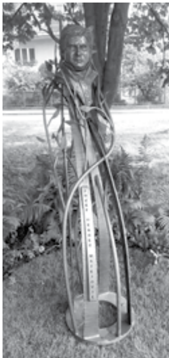
Pamätník Jozefa Dekreta Matejovie v Brezne.

Súčasťou pietnej spomienky, z príležitosti 183. výročia úmrtia Jozefa Dekreta Matejovie pri jeho buste v banskobystrickej Národnej ulici dňa 18. januára 2024, bolo aj predstavenie loga: „Rok Jozefa Dekreta Matejovie“, a to vzhľadom na tohoročné 250. výročie jeho narodenia.