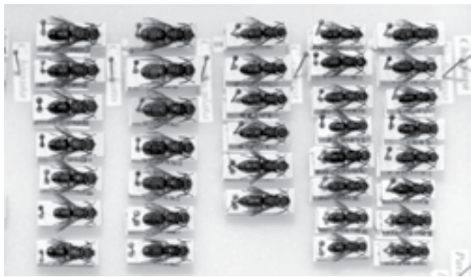
Blyskavky zo zbierky hmyzu Miroslava Kupca.

Hedychrum . Sú zaujímavé tým, že na rozdiel od iných blyskaviek, majú pomerne tvrdé kladieľko so skrytým žihadlom, ktorého bodnutie môže byť do istej miery citelné aj pre človeka.