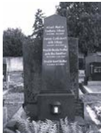
Hrobové miesto Karola Ľudovíta Libaya na Matzleinsdorfskom cintorine vo Viedni.