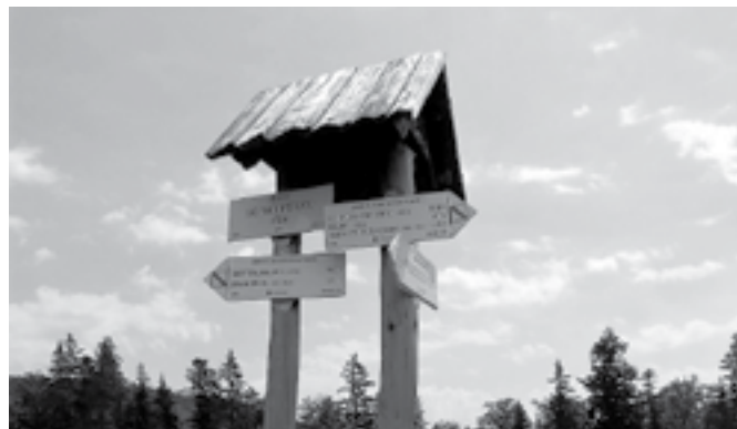
Rozcestník na kóte Lazy nad Kršňavou.

Milovníci Španej Doliny určite poznajú Lazy nad Kršňavou s čarokrásnymi letnými výhľadmi na rozľahlé pláne smaragdových kopcov. Ale ako tento termín vznikol a čo znamená?