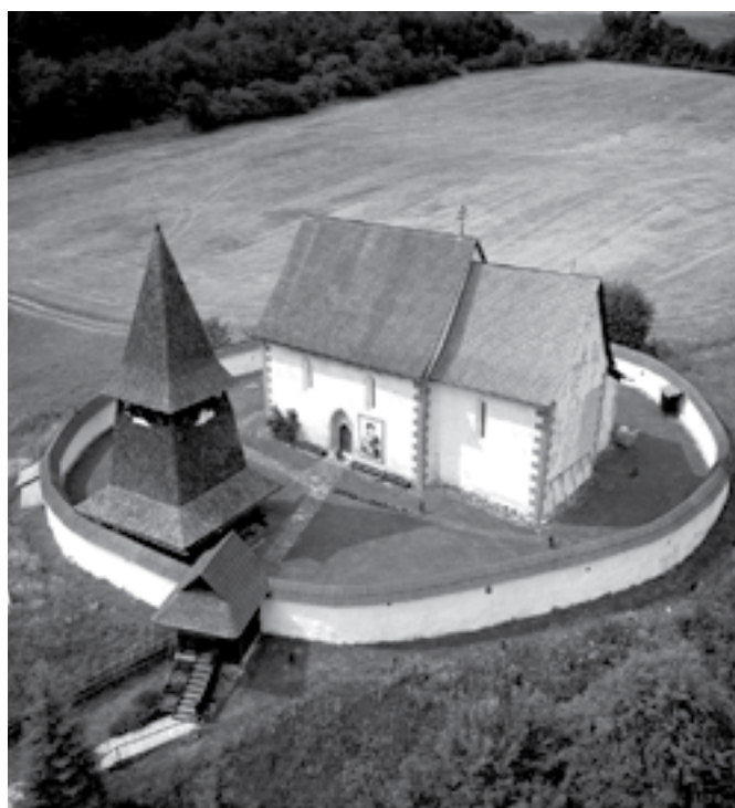
Letecký pohľad na kostol sv. Martina v Čeríne