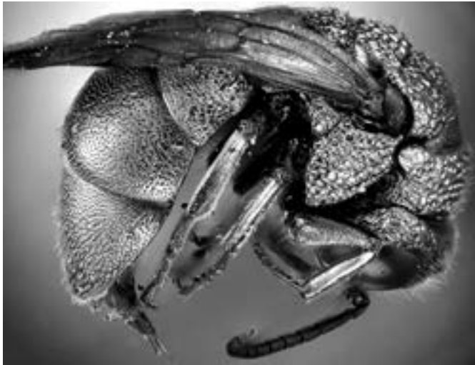
Blyskavka Hedychrum gerstaeckeri v obrannej polohe.

Blyskavky sú svojím zlatočerveným, medeným, zeleným alebo modrým kovovolesklým žiarivým sfarbením jednými z najkrajších predstaviteľov hmyzu. Hoci tieto drobné blanokřídlence patria do skupiny nazývanej žihadlovce, žihadlo majú zakrpatené. Najčastejšie sa s nimi môžeme stretnúť v tých najteplejších mesiacoch roka, ako počas slnečných dní lietajú z kvetu na kvet a živja sa sladkým nektárom alebo olizujú listy, pokryté medovicou vošiek. Najviac im vyhovujú teplé, výslnné, slabo zarastené stanovišťa s presvitajúcou piesčitou, sprašovou či hlinitou pôdou. S obľubou si sadajú na staré odumreté oslne kmeny stromov, rôzne drevené stavby alebo kamenné steny s hniezdami ich hostiteľov.