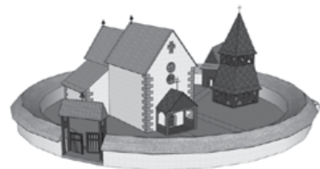
3D rekonštrukcia kostola sv. Martina v Čeríne

Kostol sv. Martina v Čeríne je krásnym príkladom gotickej sakrálnej architektúry na Slovensku, nachádzajúci sa v obci Čerín v blízkosti Banskej Bystrice. Tento kostol bol postavený koncom 13. storočia, pravdepodobne okolo roku 1315 a jeho pôvodným účelom bolo slúžiť miestnej komunite veriacich ako duchovné a spoločenské centrum. Kostol bol zasvätený sv. Martinovi z Tours, známemu kresťanskému svätcovi a patrónovi vojakov a chudobných.