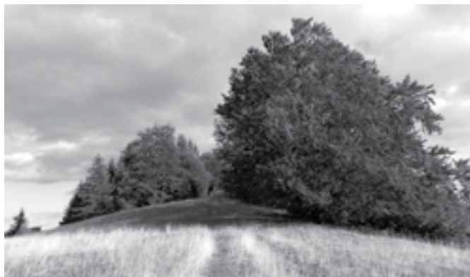
Lazy nad Kršňavou.